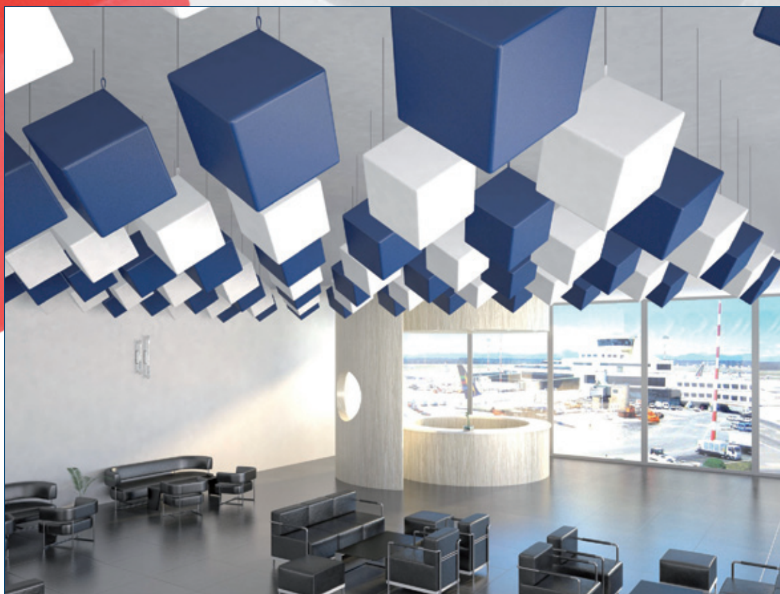
in foto Esempio di installazione del prodotto

Sospeso a 50 cm dal soffitto Aeq=0,30-1,43 Sospeso a 130 cm dal soffitto Aeq=0,33-1,49 (UNI EN ISO 354:2003, UNI EN ISO 11654:1998)