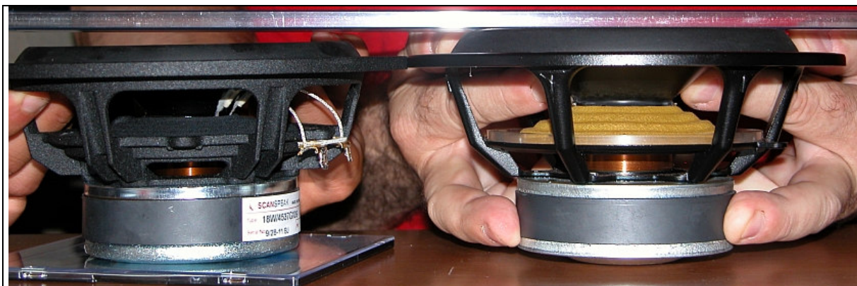
Differenza di spostamento meccanico tra un woofer della serie Discovery e il woofer della Seconda 2006 Il nuovo woofer della Seconda e Quinta 2011 è ulteriormente migliorato.

Il woofer 18w è un midrange a lunga escursione.