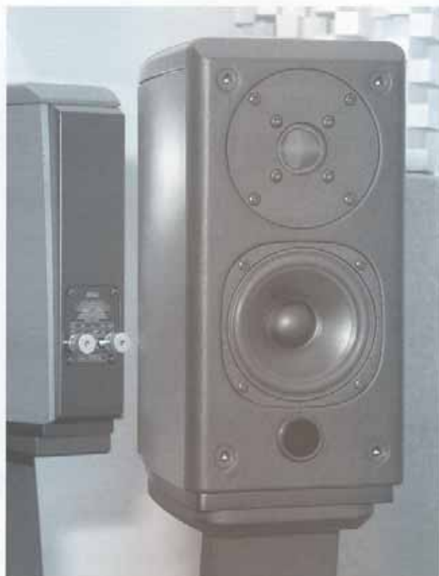
△ Opera Mini的試音報告將於下期奉上。

Simply Two LE是一部非常出色的動聽製作，也許它跟S2KR的不同在於更清通、細緻、聚焦、輕快、與較豐厚、大力的分別，買家不妨詳細比較一下。始終，Simply Two LE是不可多得，再加上其限量製作顯得更矜貴，我高度推薦。◀HIFI