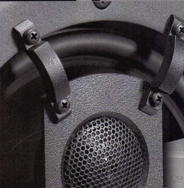
138 Norma Audio und Musikelektronik Geithain 56 YBA