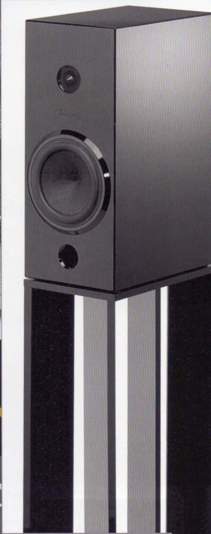
102 Intonation Audio Manufaktur